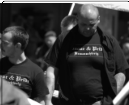
Mitgliedern von „Honour & Pride Braunschweig“ beim NPD-Aufmarsch am 18.6.05 in Braunschweig

Neben diesen „ jungen Leuten “ tummeln sich in der Region noch ein paar weitere Nazis. So z.B. die Braunschweiger Sektion von „ Honour & Pride Niedersachsen “, die bisher hauptsächlich durch die Organisation von Konzerten, Partys und einem Fußballturnier aufgefallen ist.